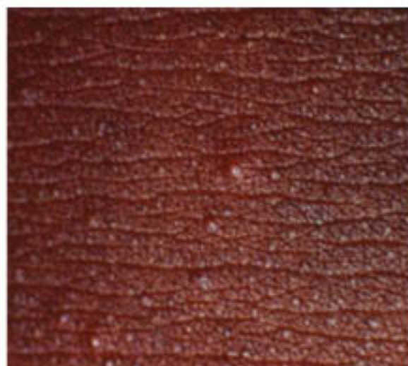
Figura 8. Alteración crónica de la piel: oncodermatitis, queratitis y severa comezón.

Las lesiones en la piel son múltiples. Los nódulos no son solo subdérmicos sino pueden localizarse en músculos, articulaciones y huesos. Son nódulos únicos o en racimos, indoloros, movibles, frecuentemente asentados sobre las eminencias óseas de la frente.