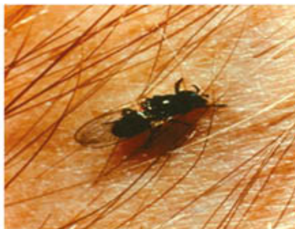
Figura 3.- Mosquito del género "Simulium"

Oncocercosis es transmitida a los humanos solo por picaduras de mosquitos negros infectados, del género "Simulium" que viven entre ríos y canales de agua. Es una enfermedad confinada a los humanos, sin animales intermediarios conocidos. En África los Simulium fecundan en corrientes torrentosas de agua y tienden a picar en las piernas y partes bajas del cuerpo humano. En las Américas estos mosquitos fecundan en los riachuelos que bajan de las colinas tropicales y tienden a picar alrededor de la cabeza.