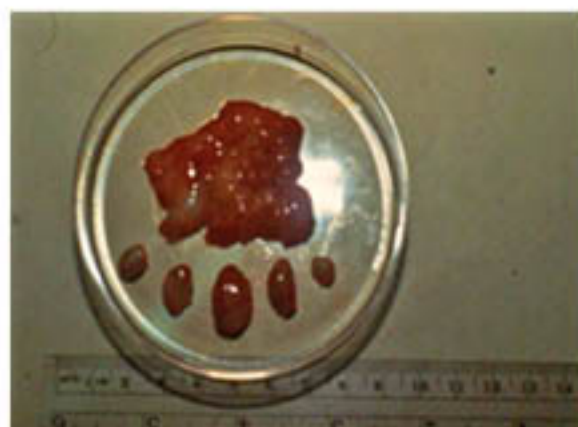
Figura 9. Cinco nódulos únicos y uno en racimo.