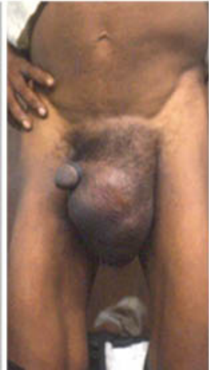
Figura 12. Hernia inguinal gigantesca consecuencia de las severas afectaciones del tejido conectivo que la Oncocercosis provoca en pacientes varones.