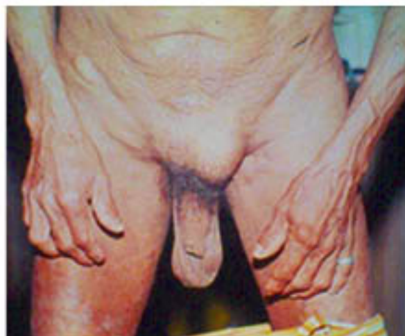
Figura 2.- Nódulos fibrosos en pelvis, manos, y hernia inguinal izquierda, frecuentes en pacientes hombres

Oncocercosis es transmitida a los humanos solo por picaduras de mosquitos negros infectados, del género "Simulium" que viven entre ríos y canales de agua. Es una enfermedad confinada a los humanos, sin animales intermediarios conocidos. En África los Simulium fecundan en corrientes torrentosas de agua y tienden a picar en las piernas y partes bajas del cuerpo humano. En las Américas estos mosquitos fecundan en los riachuelos que bajan de las colinas tropicales y tienden a picar alrededor de la cabeza.