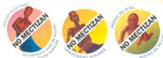
Figura 10. Cuadro instructivo para tratamiento con Ivermectina: dosis y peso.