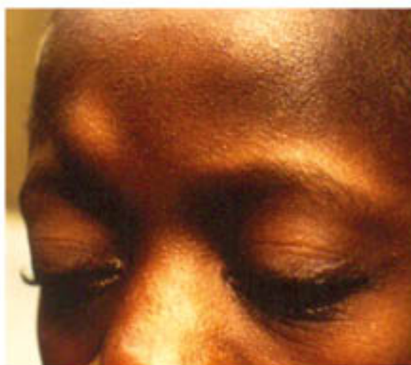
Figura 4.- Nódulo en la frente de paciente con "Ceguera de Río"

La hembra adulta o macrofilaria oncocerca puede vivir hasta 15 años. Durante ese tiempo produce millones de embriones llamados microfilarias. Cada una mide un tercio de milímetro de largo. Las microfilarias en cambio viven entre 6 meses y dos años y en ese lapso invaden la piel y el tejido conectivo. Su ciclo de vida continúa cuando las microfilarias son ingeridas por los mosquitos Simulium donde se convierten en larvas infectadas y luego el mosquito las inyecta en la piel humana por la picadura.