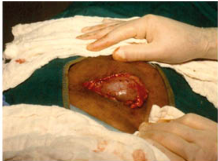
Figura 7. Nódulo único grande subdérmico: extirpación o "nodulectomía" quirúrgica